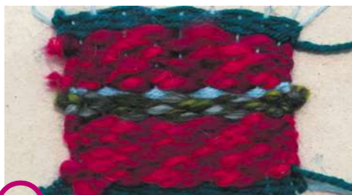
Retourne le tissage.