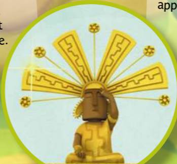
Le Grand Inca

Naïra va faire le chemin inverse : au départ, elle est obéissante et connaît bien les règles du village. Elle va apprendre à écouter son instinct et oser davantage.