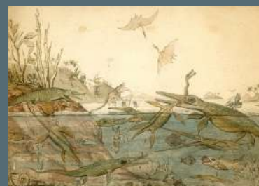
Duria Antiquior, or a More Ancient Dorset, aquarelle d'Henry de la Beche, 1830

*La fille du charpentier s'est fait un nom, et elle l'a bien mérité.