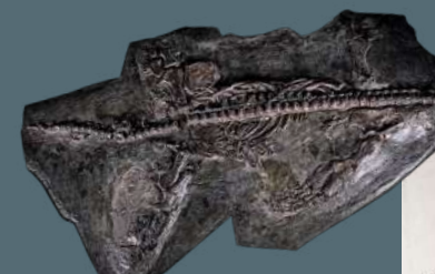
Squelette fossile de plésiosaure Dolichodeirus