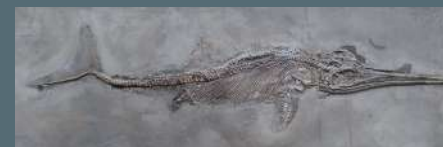
Squelette fossile d'ichtyosaure Stenopterygius