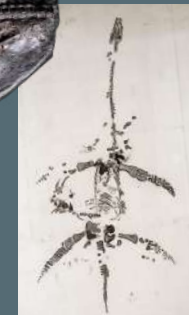
Illustration du 1 er squelette de plésiosaure trouvé complet, Mary Anning, 1823