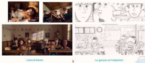
Laïka & Nemo