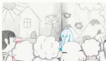
L'effet de groupe Regardez attentivement l'extrait !