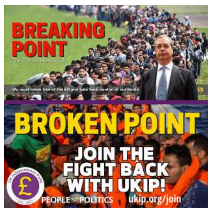
Affiche anti-immigration de l'UKIP, 2016 © UKIP

On peut lire dans The Old Oak une analyse de l'évolution politique récente de l'Angleterre, de plus en plus polarisée par la question de l'immigration. L'action du film se déroule en 2016, au moment de la crise des réfugiés syriens. Alors que le Royaume-Uni n'accueille, à l'instar de la France, que très peu de réfugiés (le gouvernement Cameron s'était dit prêt à en recevoir 20 000, le pays en a probablement accueilli beaucoup moins), les images de l'exode des populations exacerbent alors un sentiment anti-immigration déjà bien ancré dans une partie de l'électorat. Le «Brexit» (référendum sur l'appartenance du Royaume-Uni à l'Union européenne, rejetée à 51,89 %) se jouera en grande partie sur le thème du contrôle des frontières, instrumentalisé par les leaders du «Non» comme Nigel Farage et son parti UKIP (photo) et Boris Johnson. Depuis, le thème de la lutte contre immigration continue à être enfourché par les politiciens conservateurs en mal de popularité. Le premier ministre britannique Richi Sunak a fait une priorité de la chasse aux «small boats» (embarcations qui traversent clandestinement la Manche), au risque de nombreux drames humains et sans résultat pour l'instant (on estime le nombre de traversées à 45 700 en 2022, un record). Le gouverne-