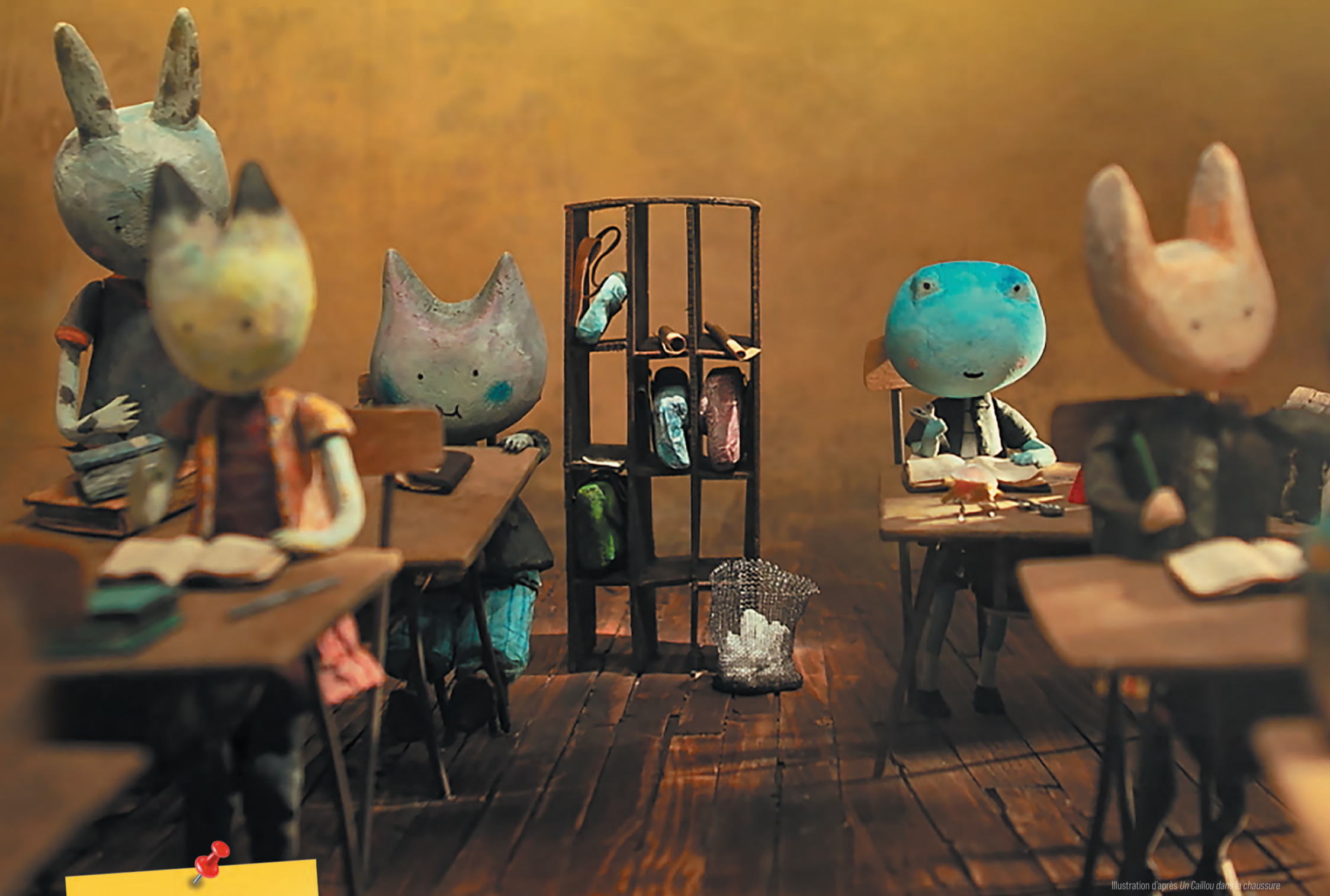
Illustration d'après Un Caillou dans la chaussure

Un caillou dans la chaussure de Éric Montchaud