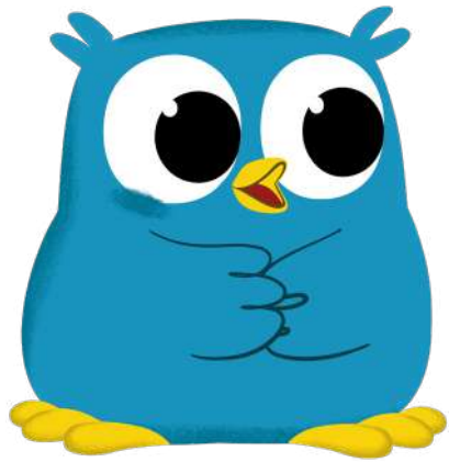
Ollie le génie

Notre Hibou est le héros de la série ! C'est aussi le génie-intuitif de toutes les situations ou presque mais il doit aussi compter sur l'aide de ses amis pour trouver de idées et des solutions