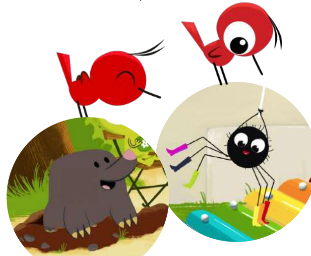
et les autres animaux...