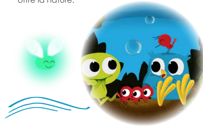
La Farandole de petits oiseaux

Personnages secondaires mais incontournables, ils sont toujours prêts à apporter leur aide pour vivre des moments uniques au coeur de la nature.