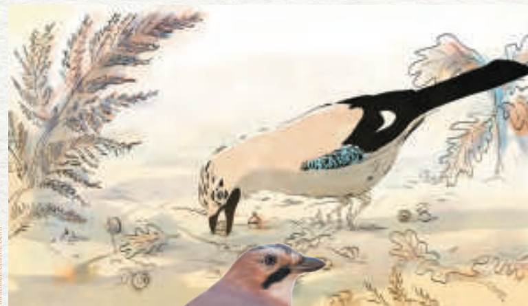
Illustration: Charlotte Béhin

Le Pic épeiche a un cri typique, un « kik » bref et net. On entend fréquemment ses tambourinages au printemps, lorsqu'il délimite son territoire, qui durent environ une demi-seconde.