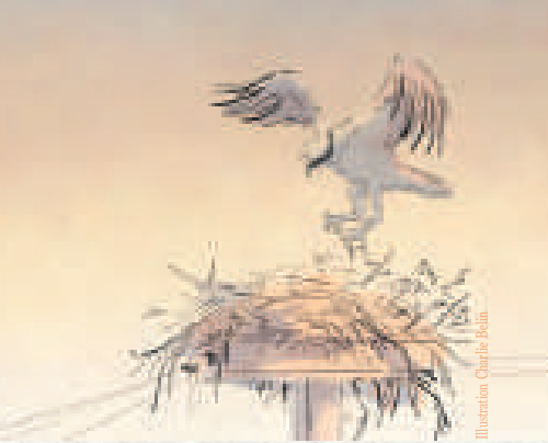
Illustration Charlotte Robin

Alimentation : Le Balbuzard pêcheur porte bien son nom puisqu'il ne consomme que du poisson. Il pêche en eaux profondes et en mer, dans des eaux claires où les poissons sont plus facilement visibles.