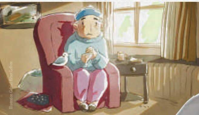
Illustration Gabriel Hémo-Lafont