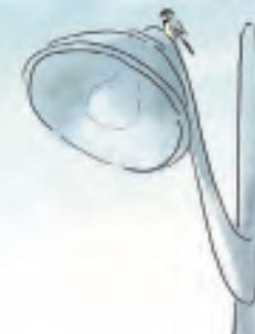
Illustration Charlie Bélin