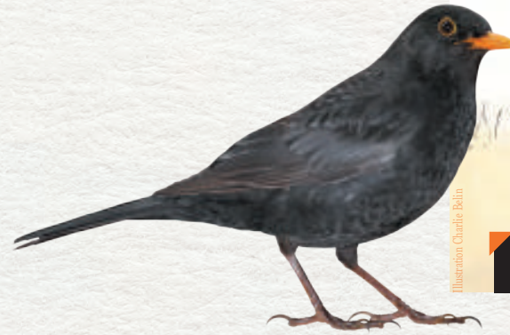
Illustration Charlotte Robin

Tandis que les balbuzards du nord de l'Europe effectuent de longs trajets migratoires pour atteindre leur site d'hivernage, les populations régionales de Méditerranée ont des comportements plus diversifiés : certains sont sédentaires, d'autres effectuent des trajets plus ou moins courts pour atteindre des sites d'hivernage situés dans le bassin méditerranéen.