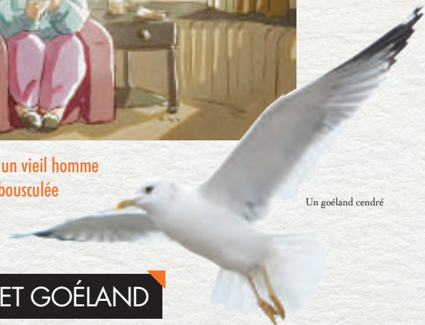
Un goéland cendré

adultes ont le dos et les ailes de couleur grise, noire ou blanche. Lorsque les oiseaux sont posés, la pointe des ailes foncée dépasse la queue blanche. Les motifs blancs sur fond noir de la pointe des ailes sont déterminants. Les becs sont puissants et plus ou moins crochus. Les pattes sont palmées. La taille est un élément important pour distinguer les goélands (du genre Larus ) de taille moyenne à grande aux autres espèces communément appelées « mouettes » de taille petite à moyenne.