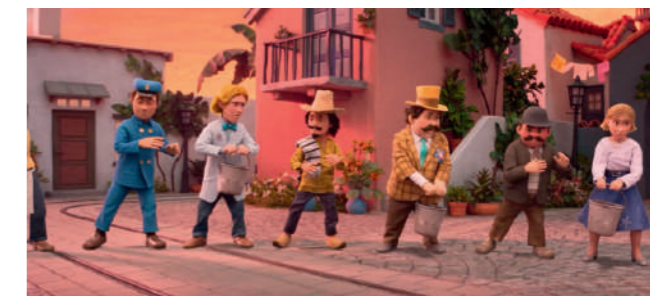
© THORBJØRN EGNER 1955, 1980 2022