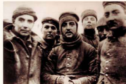
Groupe de soldats allemands avec deux Anglais, fraternisant à Ploegsteert, Belgique, le jour de Noël 1914.

Marc Ferro est co-directeur des Annales, directeur d'études à l'EHESS (École des Hautes Études en Sciences Sociales), spécialiste de la Grande Guerre, de la Révolution russe et de l'histoire du cinéma. Il a, en outre, dirigé et animé pendant dix ans le programme Histoires parallèles produit par la chaîne Arte. Reconnu dans le monde entier, il s'est fait remarquer auprès du public par ses grandes biographies (Nicolas II, Pétain), ses travaux sur la Révolution russe mais aussi ses réflexions sur l'écriture de l'histoire et les colonisations.