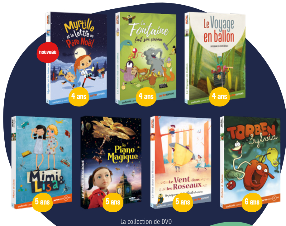
La collection de DVD

Retrouvez vos films préférés en DVD ainsi que des livres et des goodies sur notre site www.cinemapublicfilms.fr