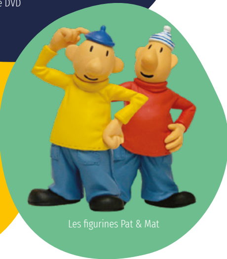
Les figurines Pat & Mat

Recevez gratuitement dans votre école une affiche et une affichette du film Le Quatuor à cornes !