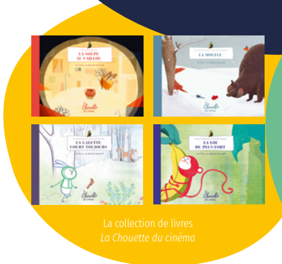
La collection de livres La Chouette du cinéma